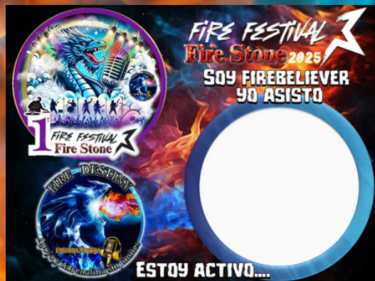
Marco para redes Diseño: Miguel "Maicky" Fire Visual