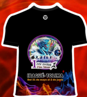
Prenda oficial Fire Stone 2025 Diseño: Fashion - Pao (BikeNers)