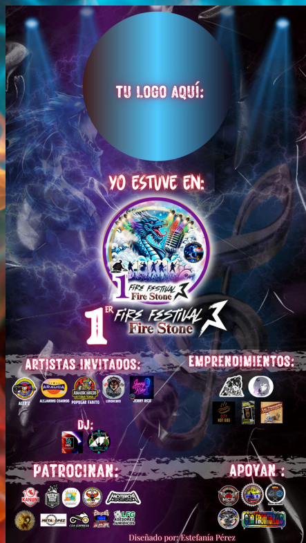
Poster conmemorativo Diseño: Estefanía Perez Fire Visual