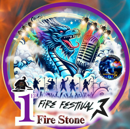
Imagen oficial Fire Festival Fire Stone 2025 Diseño: Estefanía Pérez Fire Visual