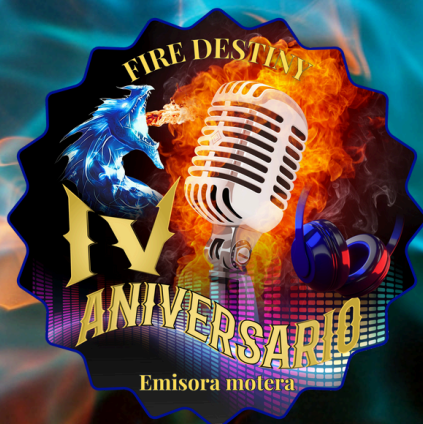
Imagen conmemorativa 4to aniversario Fire Destiny Diseño: Jhon Wivec Fire Visual