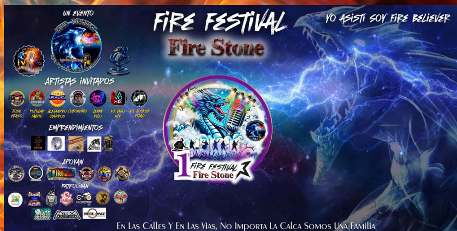
Pendón Fire Stone 2025 Diseño: Estefanía Pérez Fire Visual