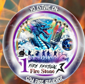
Botón conmemorativo Diseño: Estefanía Perez Fire Visual